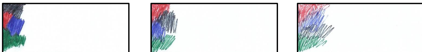
Appuie très fort.

Continue de remplir les cadres ci-dessous :