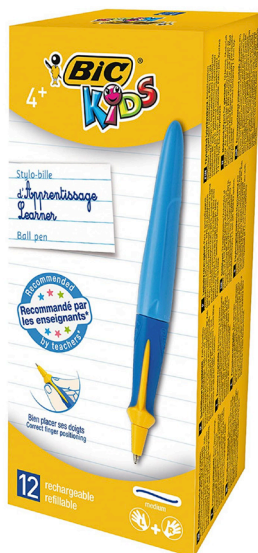
Stylos à bille d'apprentissage Bic Kids