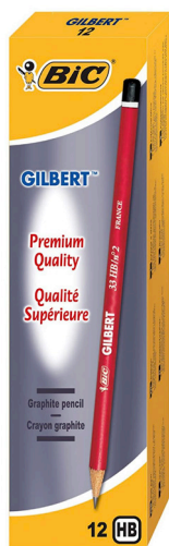
Crayons à papier Bic Gilbert