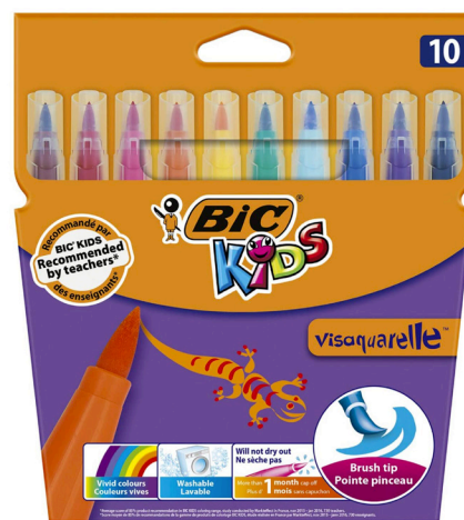
Feutres Bic Kids Visaquarelle