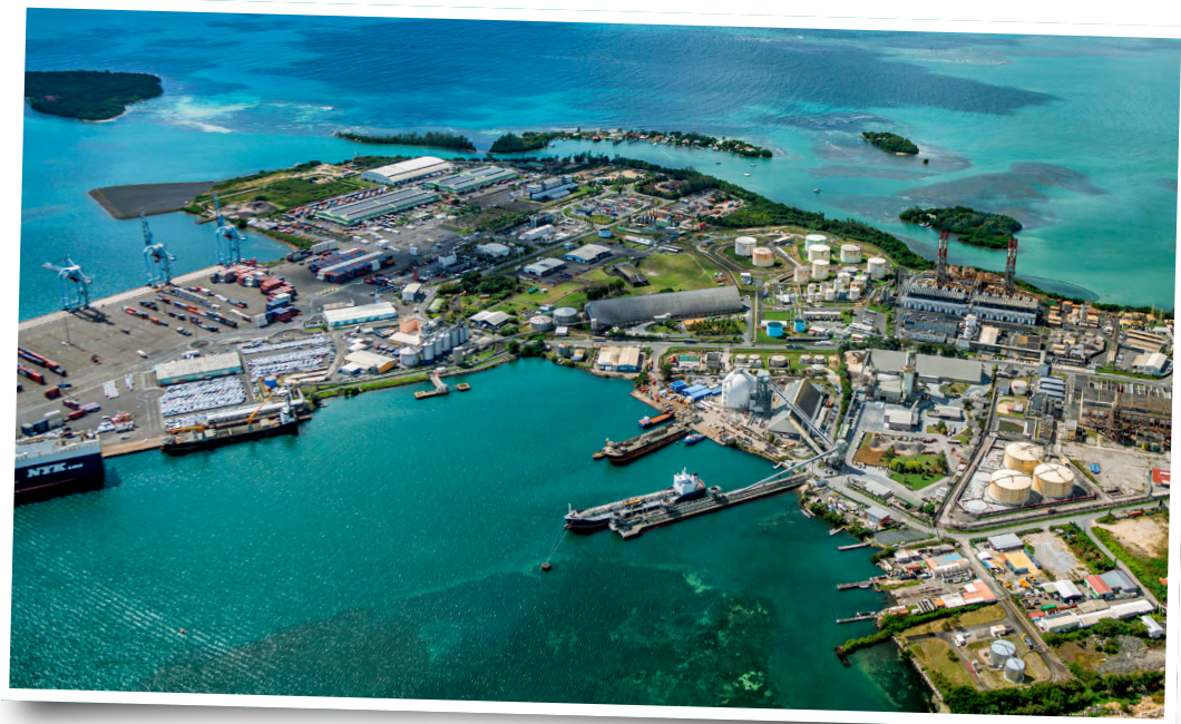
Le port de Pointe-à-Pitre