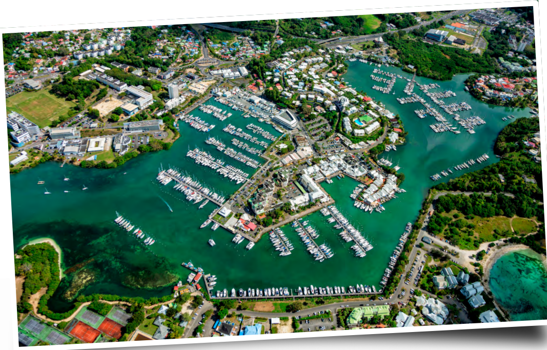
Port de plaisance de Pointe-à-Pitre