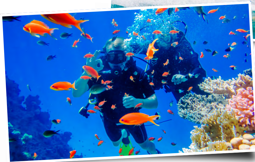
Activités à Pointe-à-Pitre