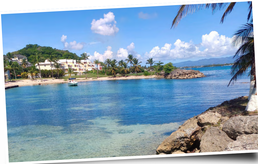
Plage de Pointe-à-Pitre